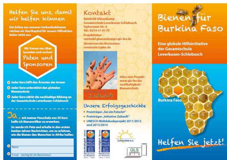
Teilansicht des Flyers (3 von 6 Seiten)

Das Plakat und der Flyer wurden auch vom Verein Horizontes am Stand auf dem Kirchentag in Hamburg 2013 eingesetzt.